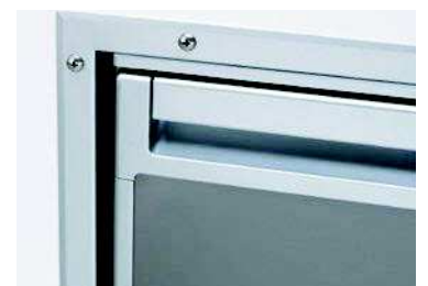
Montage avec cadre standard ou de finition