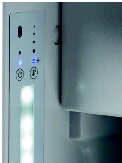
Écran du panneau de contrôle tactile