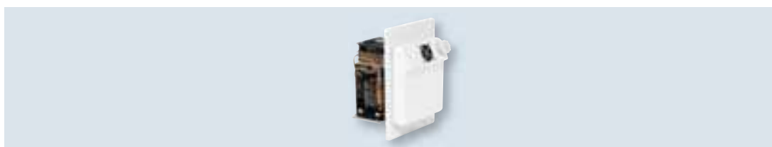
Groupe frigorifique compact CS-NC15